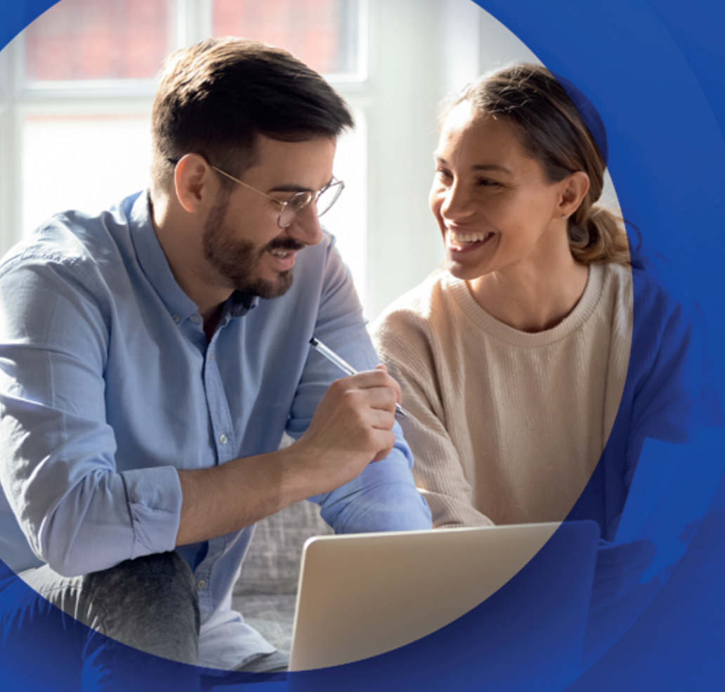
Tabela de Valores